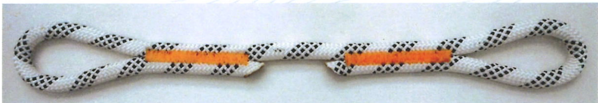
"TENDON eStatic 11 mm s šitým okem" "TENDON eStatic 11 mm with sewn eye"