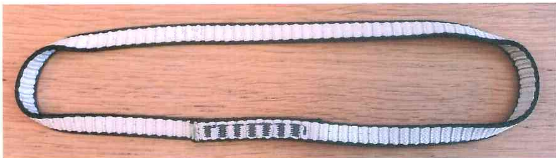
„TENDON DYNEEMA SLING 11 mm“